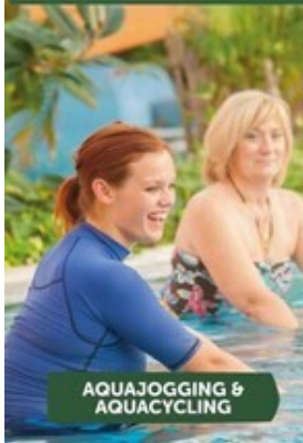
AQUAJOGGING & AQUACYCLING

IM NACHGANG AN DIE VERANSTALTUNG BESTEHT DIE MÖGLICHKEIT, DIE SAUNALANDSCHAFT ZU NUTZEN!