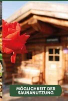
MÖGLICHKEIT DER SAUNANUTZUNG